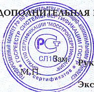
Схема сертификации 3а